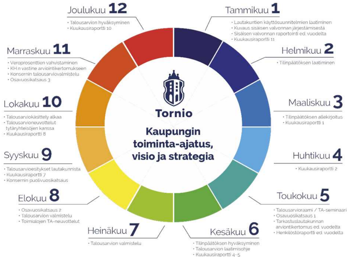
Kuva 1. Tornion kaupungin talouden ja toimintojen suunnittelun vuosikello