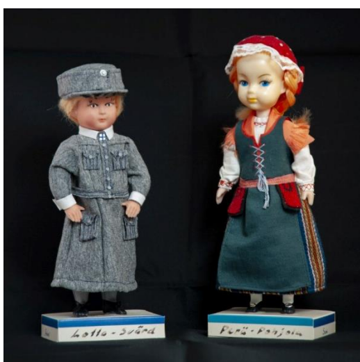
Lahjoituksena saatuja matkamuistonukkeja Lotta-asussa ja Peräpohjolan kansallispuvussa.

Vuoden alussa päivitettiin osana vastuumuseoiden hakuprosessia museon kokoelmapoliittinen ohjelma, joka oli vuodelta 2013. Museovirastolta ilmestyi 2015 ohjeistus kokoelmapoliittisen ohjelman laatimiseen, jonka pohjalta museon omaa ohjelmaa tarkennettiin eri osioiden osalta ja päivitettiin vastaamaan paremmin tämän hetken tilannetta. Työtä tullaan jatkamaan tarpeen mukaan jatkossakin.