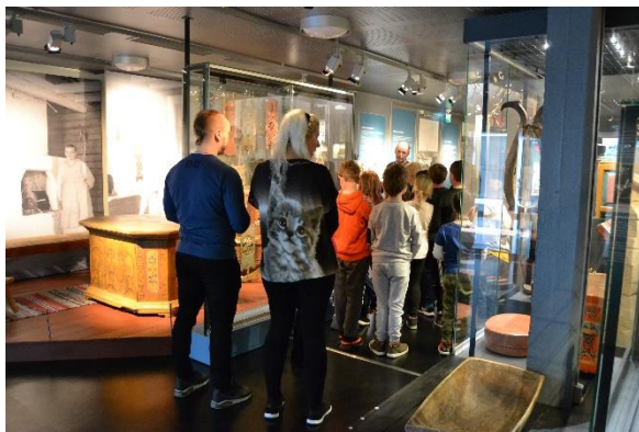
Skolgruppen från Haparanda på Tornedalens museum.

Som en del av Haparanda kommuns kultur- arvsundersökning görs skolbesöken till Tor- nedalens museum, Saivaara stenåldersby och svenska Kukkolaforseen. Museipedagogen var en av ledarna under kulturarvsbesöken . Ha- parandas andra-, femte- och sjundeklassare gjorde ett besök på museet 20–24/5 och 27/5. Grupperna guidades på svenska. Tapio Salo assisterade museipedagogen. Under veckan besöktes museet av sammanlagt 30 grupper, sammanlagt 337 elever och 37 lä- rare. Haparandas tredjeklasseleverna besökte Saivaara stenåldersby i Kärrbäck 26–29/8. Sammanlagt 121 elever besökte Saivaara, där museipe- dagogen bekantade eleverna med forskning av förhistoria. Haparandas 4-klasselever besökte svenska Kukkolaforseen 2–3/9, där besökte 114 elever. Museipedagogen berättade om historien av kvarnen och sågverket.