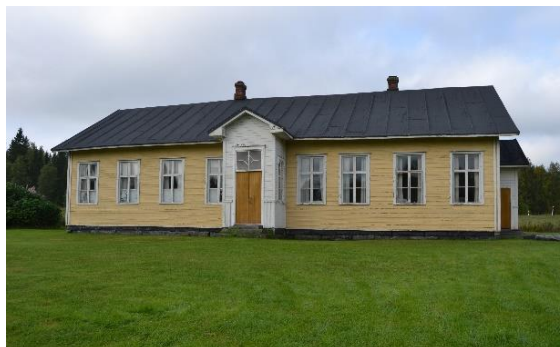
Tervola hembygdsförening renoverade skolmuseets tak med statsbidrag.

Två av lokala museer i området fick bidrag beroende på prövning från Museiverket vars användning regionmuseiforskare handledde. Kolari kommun fick 5 000 € för att utveckla hembygds museet och Tervola hembygdsförening fick 8 500 € för att renovera taket av skolmuseet. Nedertorneå sockenmuseum appreterade den nya basutställningen med bidrag tilldelat 2018.