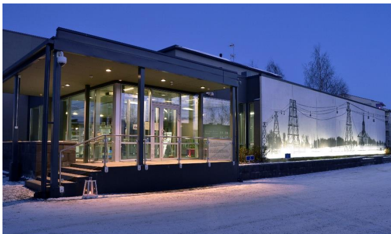
Tornedalens museums huvudentré på vintern.

2019 var museets 105:e verksamhetsår. Födelsedagsfika bjöds på museet den sjunde i juni 2019. Museet verkar under överinseende av Torneå stads livskvalitetsnämnd. Nämnden sammanträdde under året 2019 tillsammans 10 gånger. Den gränsöverskridande styrelsen, som grundades i början av 2014, svarar för utvecklingen av Tornedalens museum – Tornionlaakson maakuntamuseo.