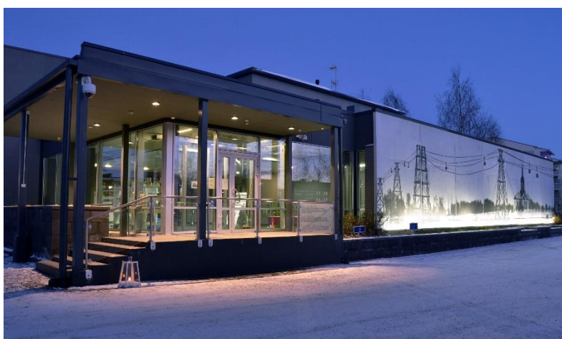
Tornionlaakson museon pääsisäänkäynti talvella.

Vuosi 2019 oli Tornionlaakson maakuntamuseon 105. toimintavuosi. Syntymäpäiväkahvit tarjottiin museolla 7.6.2019. Museo toimii Tornion kaupungin elämälaatulautakunnan alaisuudessa. Lautakunta kokoontui vuoden 2019 aikana 10 kertaa. Vuoden 2014 alussa perustettu rajanylinen johtokunta vastaa Tornionlaakson maakuntamuseon – Tornedalens museumin kehittamisestä.