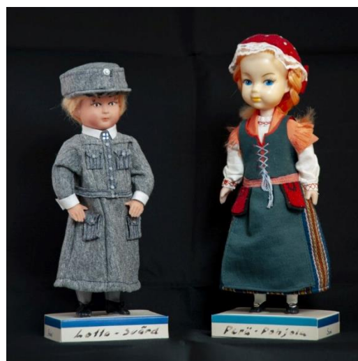
Reseminne dockor i Peräpohjola nationaldräkt och Lotta-dräkt, donationer.