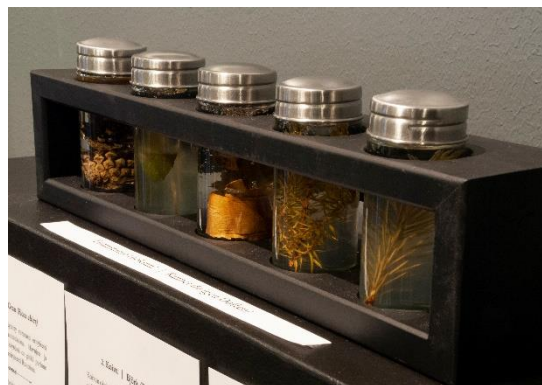
Vaihtuvissa näyttelyissä pyritään hyödyntämään eri aisteja. Kuvassa Anna - kirkkoon haudattu-näyttelyn haistelupurkkeja.

Anna – kirkkoon haudattu -näyttelyn yhteyteen suunniteltiin työpaja, jossa kerrottiin surun ilmaisen näkyvistä muodoista. Tarhaikäisille ja esikoululaisille suunnatussa surunappityöpajassa valmistettiin surunappi ja 7-12-vuotiaille suunnatussa työpajassa valmistettiin hautajaiskaramelli. Anna – kirkkoon haudattu näyttelyn työpajoihin osallistui 60 lasta.