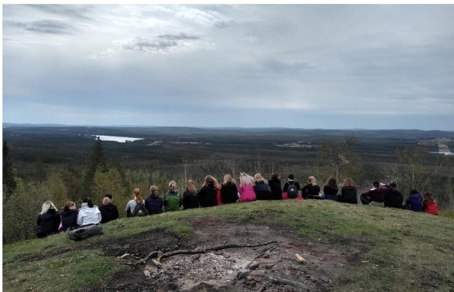
Niondeklassare på berget Jupukka i Pajala bekantar sig i Struves meridianbåge.

Tornedalens museum fick under det europeiska kulturarvsåret 2018 bidrag från Museiverket för projektet Upptäcktsresandenas Tornedalen. Projektet genomfördes under åren 2018–2019. Projektet bestod av workshops och utflykter tillsammans med Pudas skolans niondeklassare samt av ett upptäcktsresandespel och 360-fotograf som tas fram i samarbete med Lapplands yrkeshögskola. Under våren 2019 gjordes en utflykt med Pudas skolans internationella klassens elever till Nedertorneå kyrkan och utflykterna till punkterna i Struves kedja, i Jupukka i Sverige 8/5 och Aavasaksa i Finland 20/5. Studerande vid Lapplands yrkeshögskola lärde sig om hur trianguleringsexpedition arbetar både i skolan och på museet och studerande planerade brädspelets prototyp. Spelpjäskrevs ut med en 3D-skrivare enligt miniatyrfigurer som studerande hade ritat. Studerande gjorde också en 360-fotograferingsresa för museets VR-glasögon under hösten till Pullinki och Aavasaksa mätpunkterna.