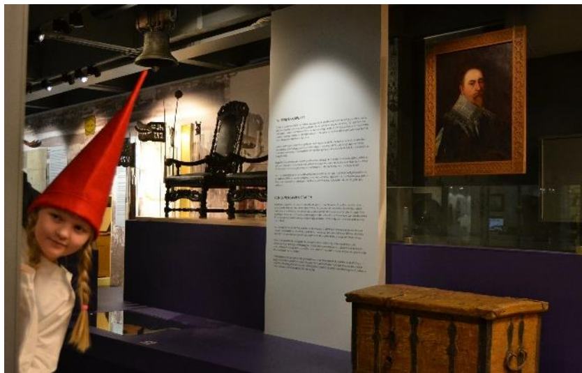
Tonttu Joulun avaus -tapahtumassa.

Joulouutlet järjestettiin 23.-24.11. Tapahtumassa myytiin museokaupan uutuuksia ja museon pois- tokirjoja.