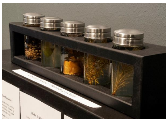
I tillfälliga utställningar syftas att utnyttja olika sinnen. Doftburken från utställningen Anna, begravd i kyrkan.

Barnens jul på museet var en funktionell utställning med fasta workshoppar. Sammanlagt 16 skol- och förskolegrupper, dvs. 219 barn besökte utställ-ningen och dess workshoppar. Museets personal inredde jultomtens arbetsrum i bibliotekets fön-s-ter, som var framme under utställningen.