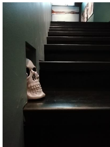
Tätä kuvaa käytettiin Kauhukartano -tapahtuman Instagram-päivityksessä.

Tornion kouluille tiedotettiin museon ajankohtaisista näyttelyistä ja työpajoista syyslukukauden alussa koulutiedotteella, joka jaettiin opettajille paitsi tulosteena myös Wilmassa. Haaparannalle ja suomalaisiin lähikuntiin koulutiedote lähetettiin sähköisesti. Koulutiedote toi varauksia opastuksille ja työpajoihin.