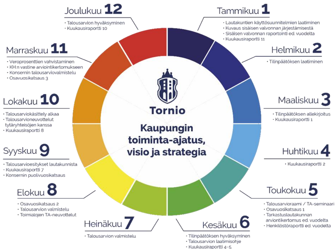
Kuva 1. Tornion kaupungin talouden ja toimintojen suunnittelun vuosikello