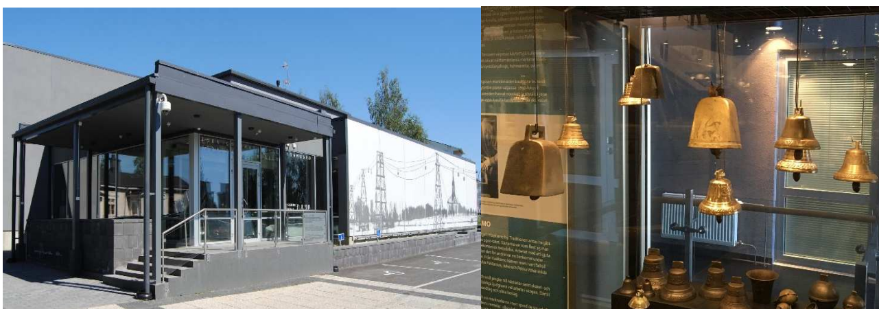
Museon julkissivu ja kaakamolaisia kelloja perusnäyttelyssä.

Vuosi 2018 oli Tornionlaakson maakuntamuseon 104. toimintavuosi. Museo toimii Tornion kaupungin elämänlaatulautakunnan alaisuudessa. Lautakunta kokoontui vuoden 2018 aikana 9 kertaa. Vuoden 2014 alussa perustettu rajanylinen johtokunta vastaa Tornionlaakson maakuntamuseon – Tornedalens museumin kehittamisestä.