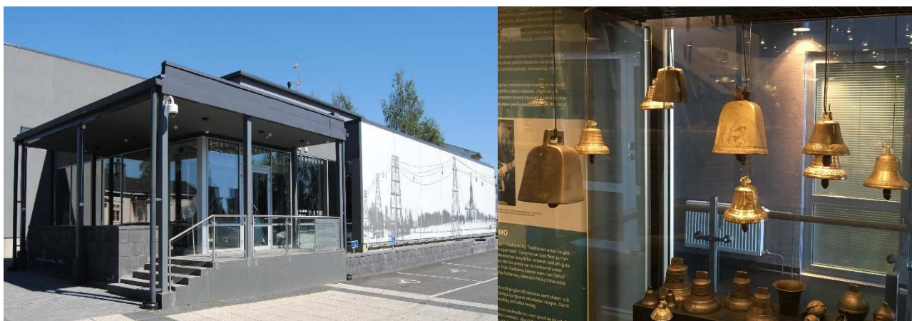
Museets fasad och klockor av brons från Kaakamo i basutställningen.

2018 var museets 104:e verksamhetsår. Museet verkar under överinseende av Torneå stads livskvalitetsnämnd. Den i början av 2014 grundade gränsöverskridande styrelsen svarar för utvecklingen av Tornedalens museum – Tornionlaakson maakuntamuseo.