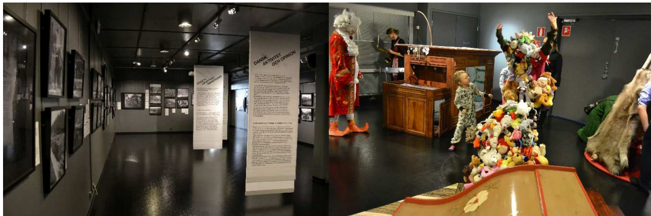
Suomen sisällisota 1918 ja Osaan itse! –näyttelyt.

Museo oli avoinna koko vuoden ja näyttelyihin tutustui 7 256 museovierasta. Museo oli avoinna ti-to 11.00–18.00 ja pe-su 11.00–15.00. Pääsymaksut olivat aikuisilta 5 euroa ja alle 18-vuotiaat pääsivät museoon ilmaiseksi. Tornionlaakson maakuntamuseo on museokorttimuseo.