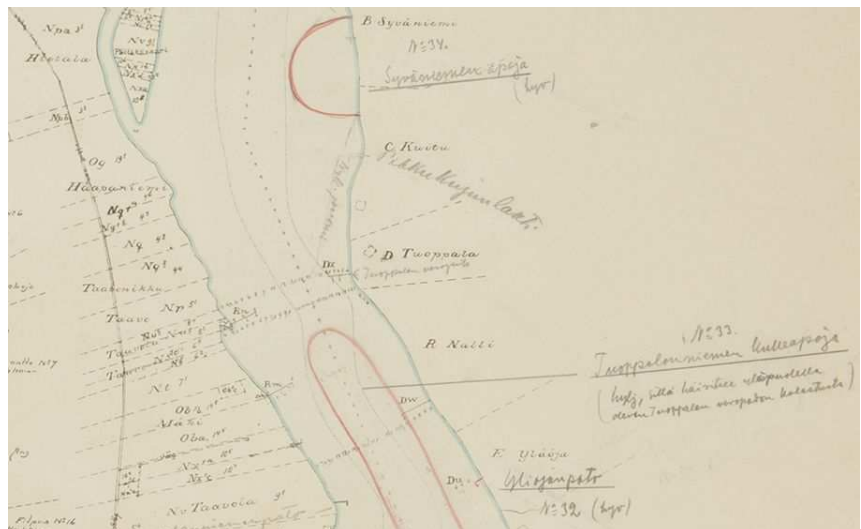
Ett utdrag ur kartbokens sida 22: Fiskeplatser ovanför Kattilakoski.

Arkivarien tillhör styrgruppen för digitaliseringskartläggning av Lapplands bibliotek som under 2018 hade tre möten. Digitaliseringskartläggningen har ansökt om förlängning för 2019 och styrgruppens verksamhet fortsätter fram till årets slut.