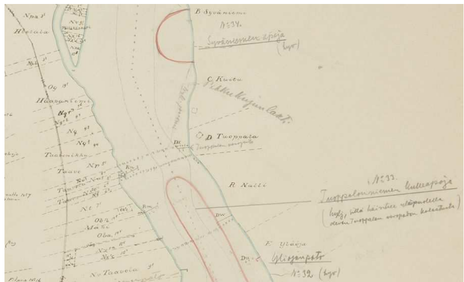
Ote karttakirjan aukeamalta 22: Kattilakosken yläpuolisia apaja- ja kalastuspaikkoja.

Arkistonhoitaja kuuluu Lapin kirjastojen digitointiselvityksen ohjausryhmään, joka piti vuoden 2018 aikana kolme etäkokousta. Digitointiselvitykselle on haettu jatkoaikaa vuodelle 2019 ja ohjausryhmän toiminta myös jatkuu hankkeen loppuun saakka.