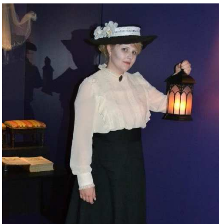
Specialguidning "Flygande nåjder och vackra spöken"

I anknytning till guidningarna av de tillfälliga utställningarna tillhandahölls uppgifter, workshops, till skolbarnen . I samband med utställningen Finska inbördeskriget 1918 funderade man tillsammans med elever, i helklass eller indelade i grupper, om bakgrunden till bilderna, bildmotiv och det egna förhållandet till bilder och inbördeskriget. I workshopen i anslutning till Från forndräkt till Marimekko -utställningen tillverkades band som dekorerades med bronsspiraler. Workshopen anordnades i anslutning till basutställningen. Sammanlagt 117 barn och 15 lärare deltog i Inbördeskrigets workshop och 162 barn i bandtillverkning tillsammans med lärarna. Det totala antalet workshops var 32.