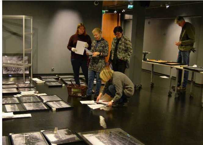
Planering av utställningen.