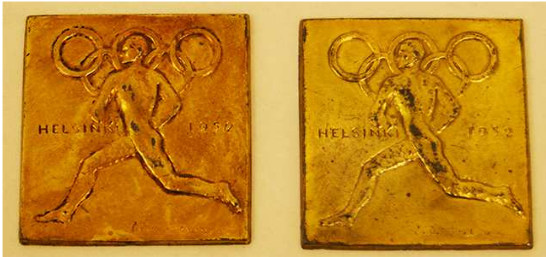
Helsingin olympialaisten 1952 muistomitali.

Museo oli jäsenenä ammatillisten museoidentallennus- ja kokoelmayhteistyöverkosto TAKOssa. Tornio kuuluu pooli 2:en, jonka tallennusalue on ”Yksilö, yhteisö ja julkinen elämä”. Amanuessi osallistui TAKO:n kevätseminaariin paikan päällä ja syysseminaariin etäyhteydellä. Poolikokouksia pidettiin kuluneena vuonna kaksi seminaarien yhteydessä. Museo on jatkanut tallennusvastuuseensa kuuluvan valtakunnan rajan ylisen esinekokoelman kartuttamista ja sai kokoelmiinsa muun muassa Blaupunkt- televisioradioyhdistelmän Haaparannan Lappträskistä. Amanuessi osallistui lisäksi maakunnallisten museoiden kokoelmavastaavien yhteistyöryhmän (KOVA MAAKUMU) toimintaan.