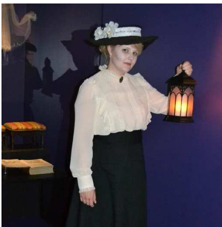
Erikoisopastus "Lentonoitja ja kauniita kummituksia"

Syksyllä 2017 kehitettiin aikuisille suunnattu erikoisopastus "Lentonoitja ja kauniita kummituksia", jota voi tilata ryhmille normaaliin opastushintaan. Kierroksella kerrotaan alueen noidista, uskomuksista ja kummitustarinoista. Kummitusaiheisia Lentonoitja ja kauniita kummituksia -teemaopastuksia järjestettiin 13 kpl. Kierrokseen osallistui yhteensä 120 henkilöä.