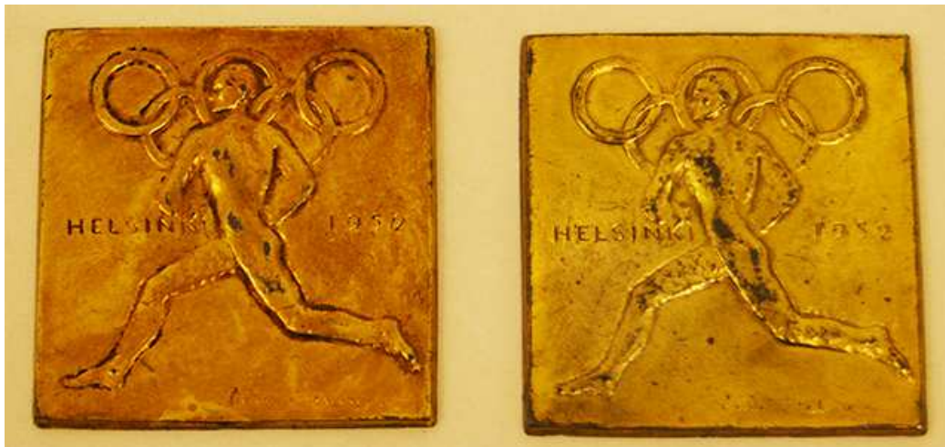
Minnesmedalj av Olympiska spelen i Helsingfors 1952.

Museet var medlem i samarbetsnätverket TAKO för professionella museers dokumentations- och samlingsarbete. Torneå tillhör pool 2, vars dokumentationsområde är Individen, samhället och det offentliga livet. Amanuensen deltog i TAKO:s vårseminarium på plats och i höstseminariet på distans. Under det gångna året hölls två poolmöten i samband med seminarierna. Museet har fortsatt att utöka den nationsgränsöverskridande föremålssamlingen som ingår i dokumentationsansvaret och fick bland annat en kombinerad TV-Radioapparat med märket Blaupunkt som donation från Lappträsk i Haparanda till sina samlingar. Amanuensen deltog också i verksamheten inom arbetsgruppen för regionmuseernas samlingsansvariga (KOVA MAAKUMU).