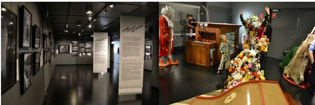
Utställningar Finska inbördeskriget 1918 och Kan själv!

Museet var öppet hela året och utställningarna besöktes av 7 256 personer. Museets öppettider var tisdag-torsdag 11-18 och fredag-söndag 11-15 finsk tid. Inträdet för vuxna var 5 euro och gratis för alla under 18 år. Museikortet gäller i Tornedalens Museum.