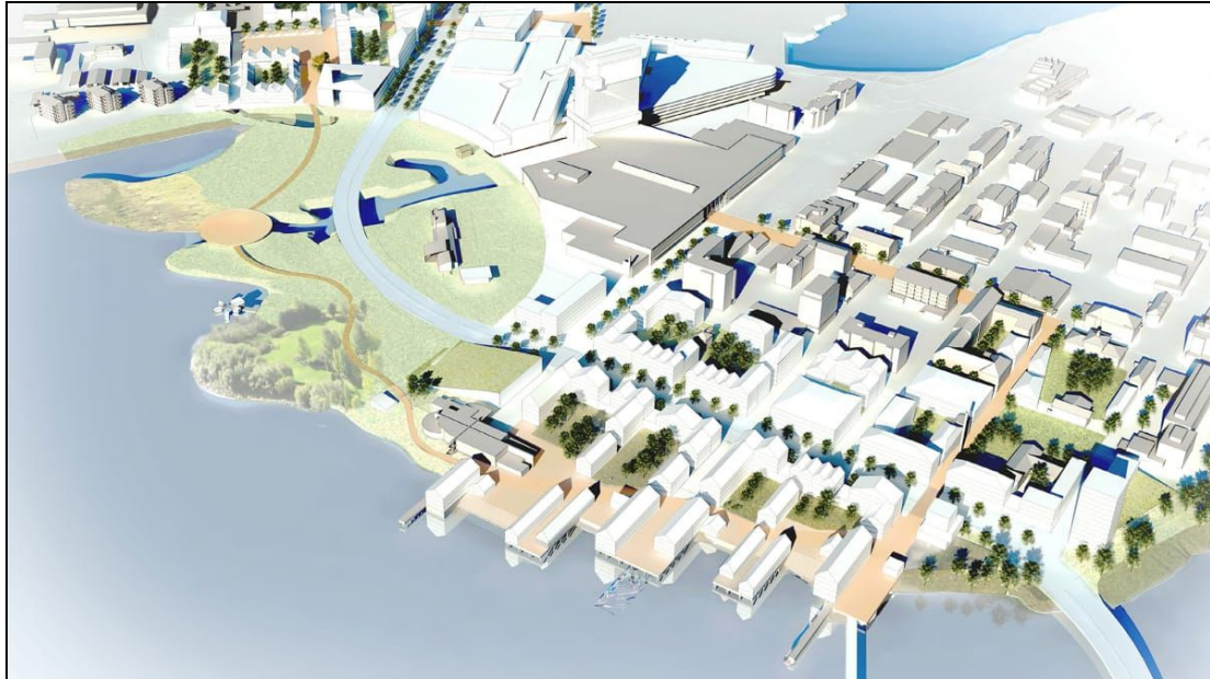
Europan 14 –arkkitehtuurikilpailun voittajatyö: Two Cities – One Heart (TornioHaparanda).

https://www.europan-europe.eu/en/news/e14-topic-productive-cities